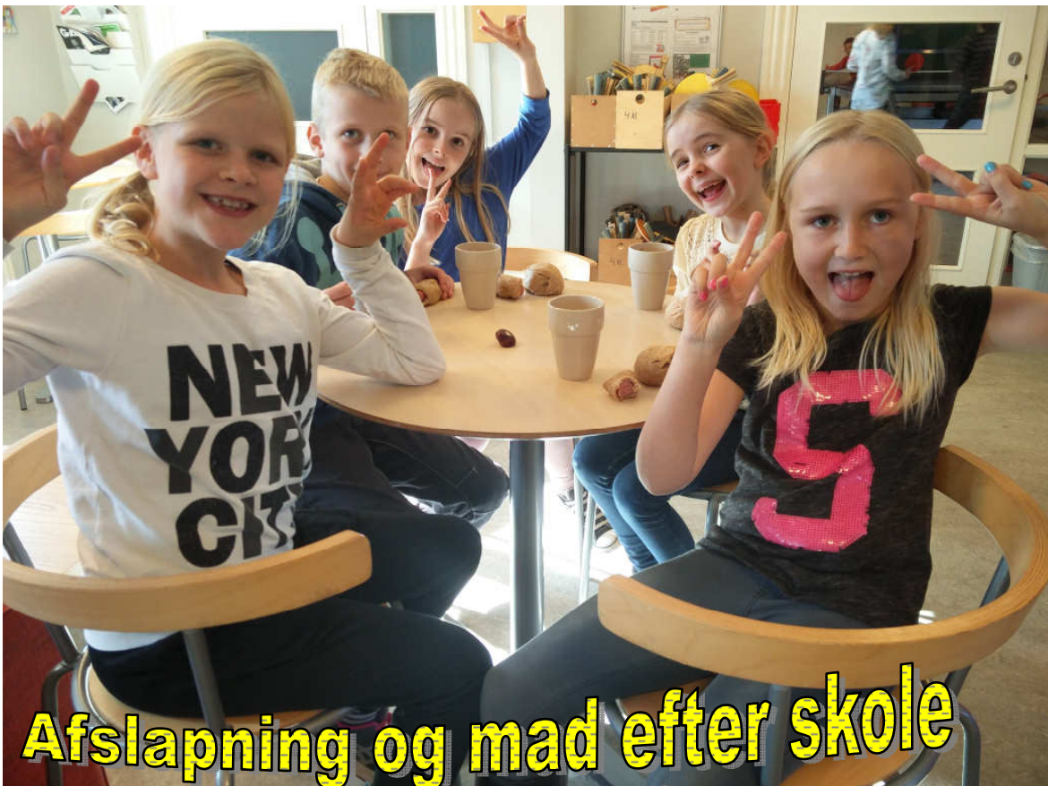
Afslapning og mad efter skole

Året har budt på forskellige større arrangementer, som vore miniklubmedlemmer, ivrigt har deltaget i.